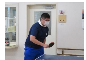
食堂に卓球台があります