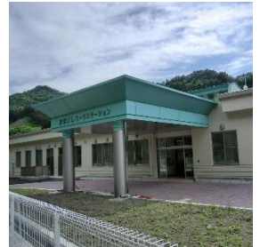
かまいしワーク・ステーション