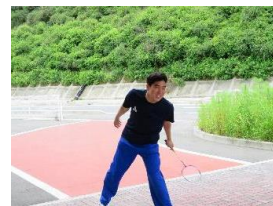
外でバドミントン