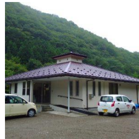
まごころ就労支援センター

アセスメントを行う場合は、普段の家庭での様子や実習での様子、学校での作業態度など多方面から情報収集します。アセスメント実施に関わり、保護者の皆様にも情報提供や会議等への参加を依頼する事がありますので、ご協力よろしくお願いします。